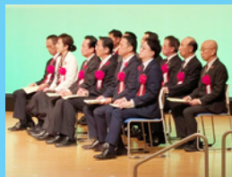
12/6 豊田市社会福祉大会に出席