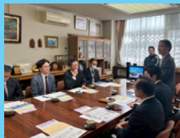
10/29 県立御津あおば高校のフレキシブルハイスクール等を調査