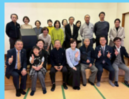
12/7 浜口誠参議員、丹野みどり衆議員と地域座談会に参加