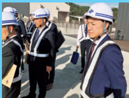
11/7 建設委員会で安威川ダム @大阪府を視察