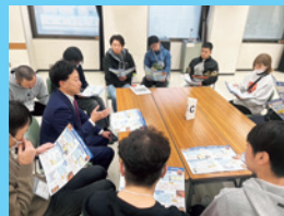
12/9 フタバ産業労組の議員座談会に参加