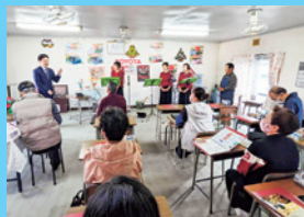
11/24 地域の方々が集うおしゃべりサロンで県政報告