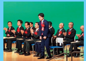
12/9 豊田市社会福祉大会に出席